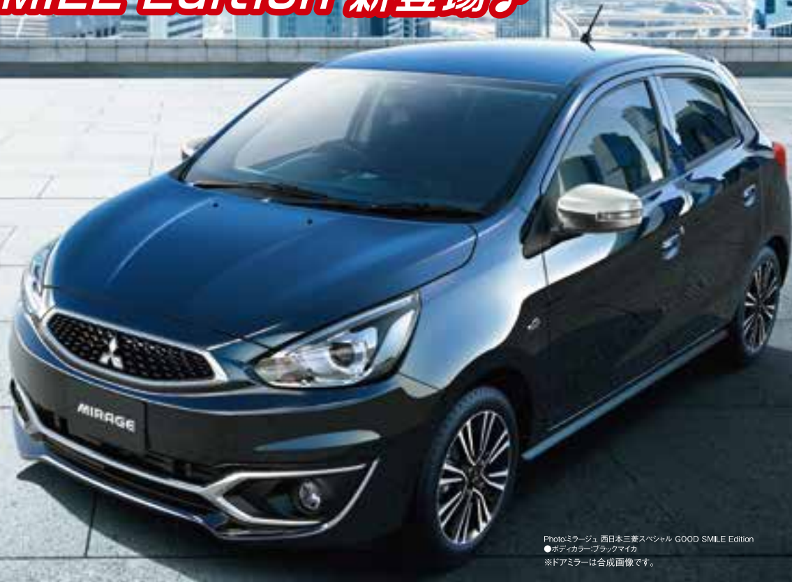
Photo:ミラージュ 西日本三菱スペシャル GOOD SMILE Edition ●ボディカラーブラックマイカ ※ドアミラーは合成画像です。