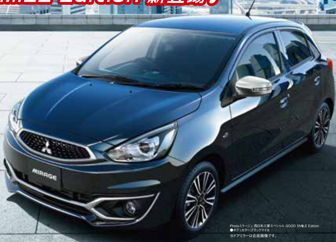
Photo:ミラージュ 西日本三菱スペシャル GOOD SMILE Edition ●ボディカラーブラックマイカ ※ドアミラーは合成画像です。